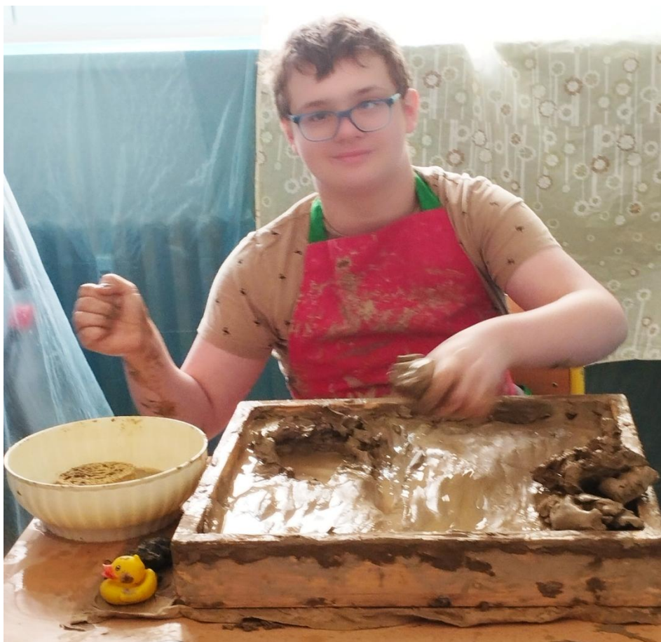
Milošek a jeho řeka