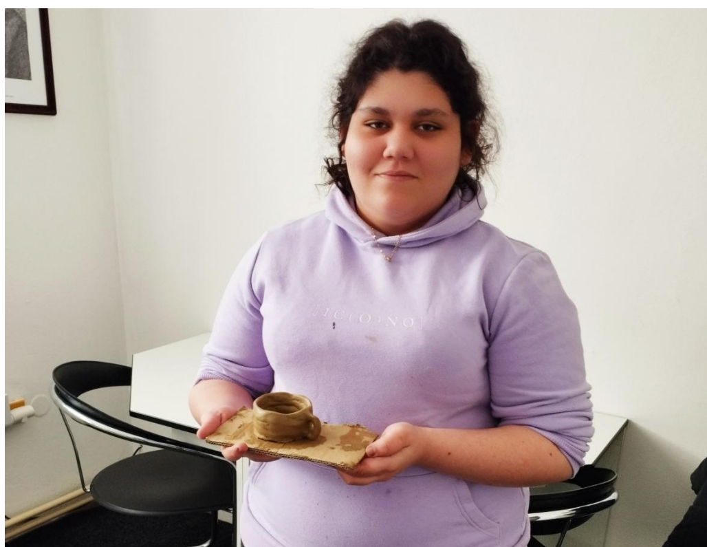
Terezka si vyrobila šálek na čaj