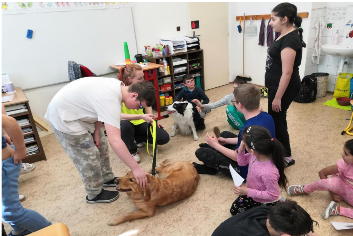
S našimi chlupatými kamarády