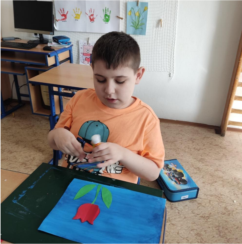
Ondra lepí tulipán