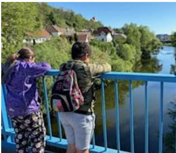
Kocháme se Jizerou, řekou, která protéká naším městem

Základní kroky práce s PC se žáci učí v hodinách Informatiky. Osvojují si ovládání PC pomocí myši a klávesových zkratk, práci v textovém editoru, zvládají práci s vybranými jednoduchými výukovými programy. PC je ovšem důležitou učební pomůckou i v ostatních hodinách – pomáhají jako pomůcka ke zvětšování textu pro žáky se zrakovou vadou, slouží k využívání symbolů při alternativní komunikaci apod. Získané dovednosti se tak pro žáky stávají výhodou v praktickém životě.