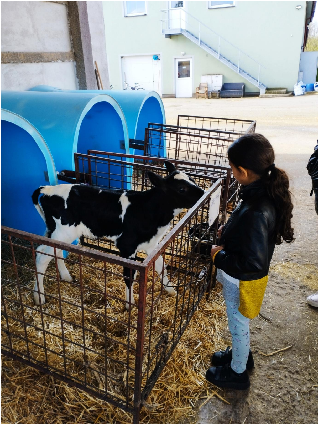
U telátek – exkurze ZD v Dolním Slivně