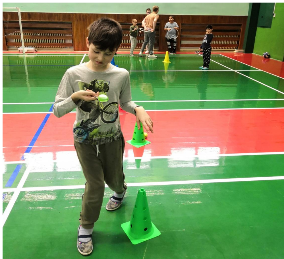
Hurááá, nespadlo mi!