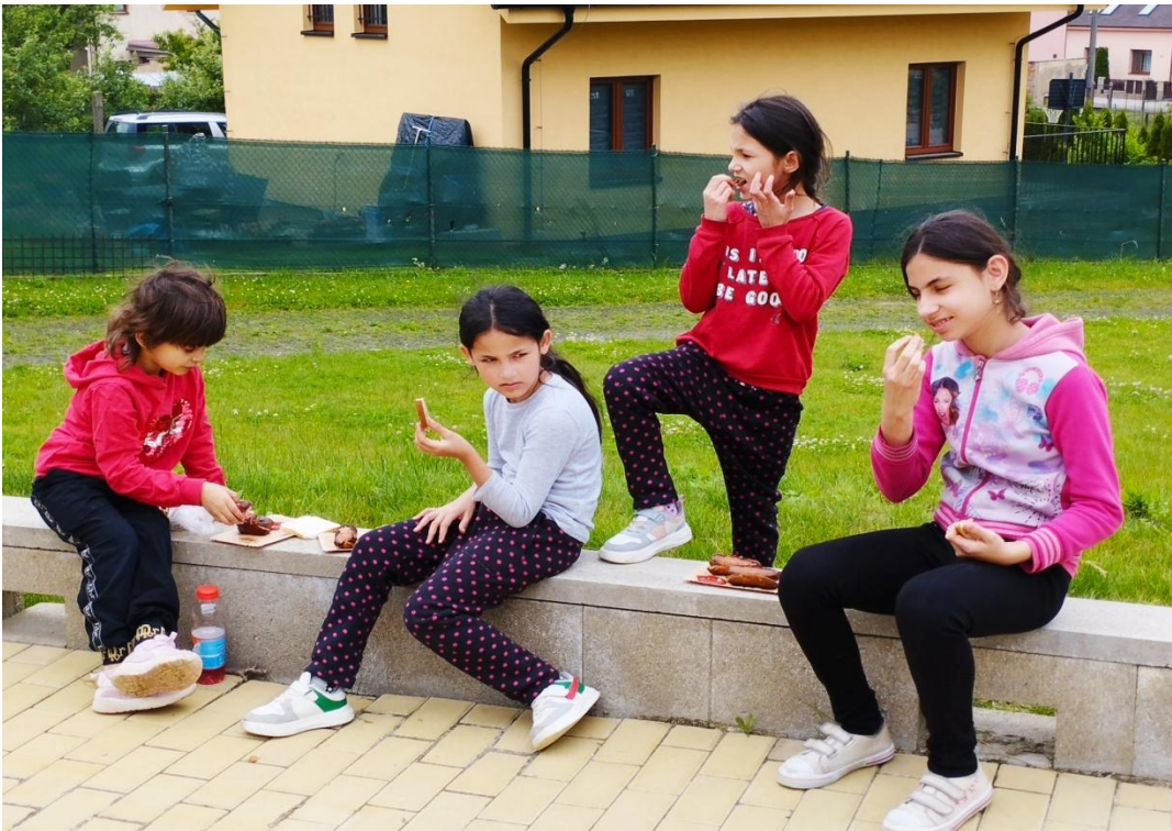
Po buřtíkách se jen zaprášilo