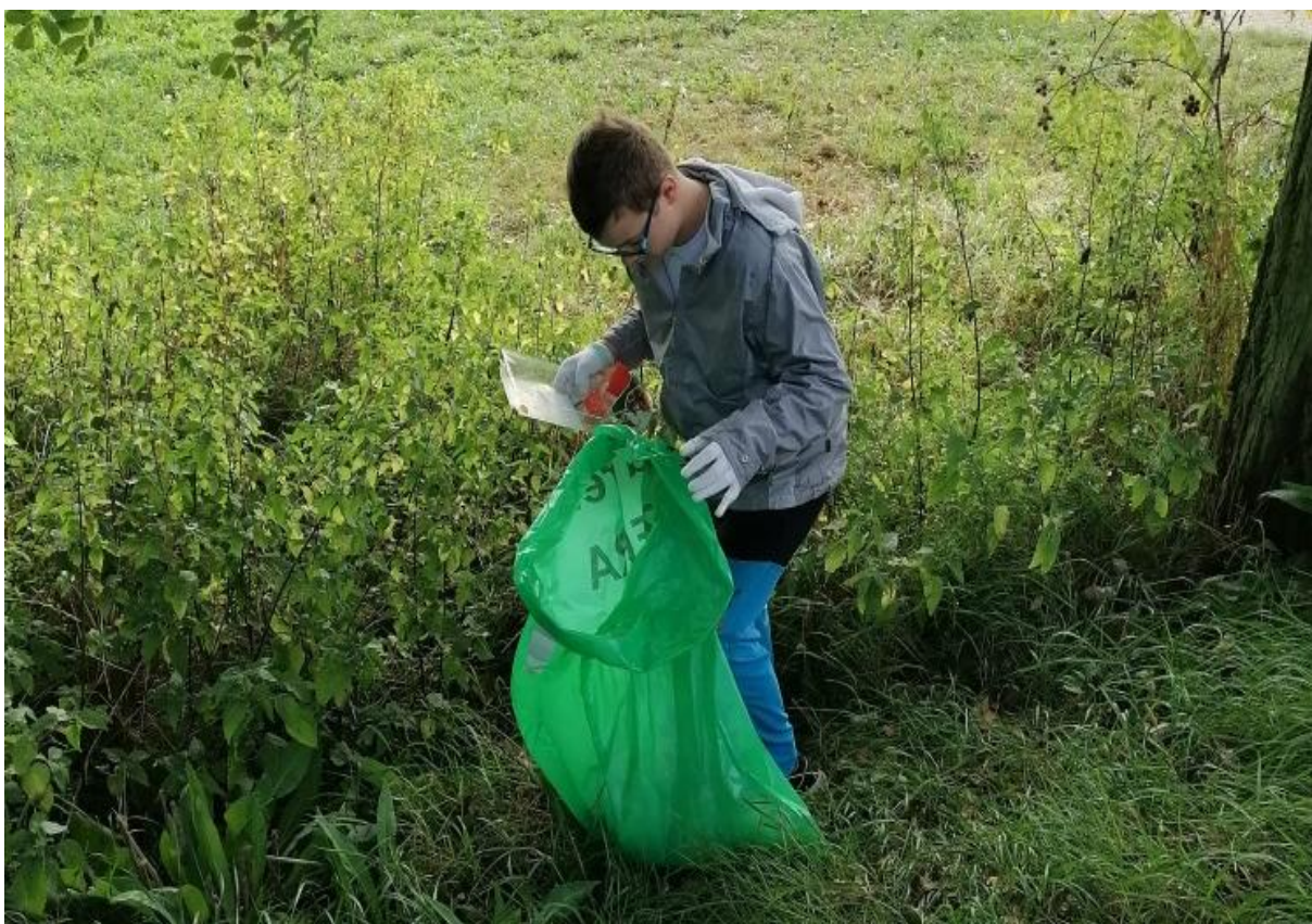
Čistá řeka Jizera – pomáháme přírodě

Upcyklovali jsme v oblasti umění. Opětovně jsme využili pastelky, které se nedaly ořezat. Měly totiž rozlámané tuhy. Vyrobili jsme z nich obraz. Povedl se, posuďte sami.