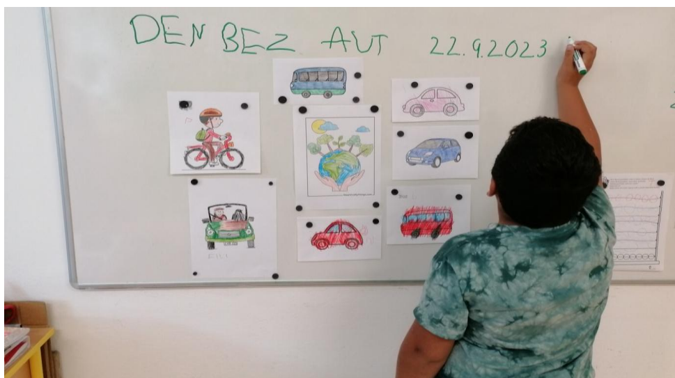
EVVO Den bez aut – projektový den

Také se učíme hospodařit s penězi. Při hře na obchod jsme se nemohli dopočítat. Do virtuálních vozíků jsme nakupovali různé zboží. Každý žák měl určitou částku peněz. Někdo nakupoval jako zběsilý a utratil více peněz, než měl, někdo byl spořivější, moc neutrácel a se svými penězi „vyšel“. Použití peněz je důležitou funkční dovedností pro nezávislý život, zejména pro žáky naší školy.