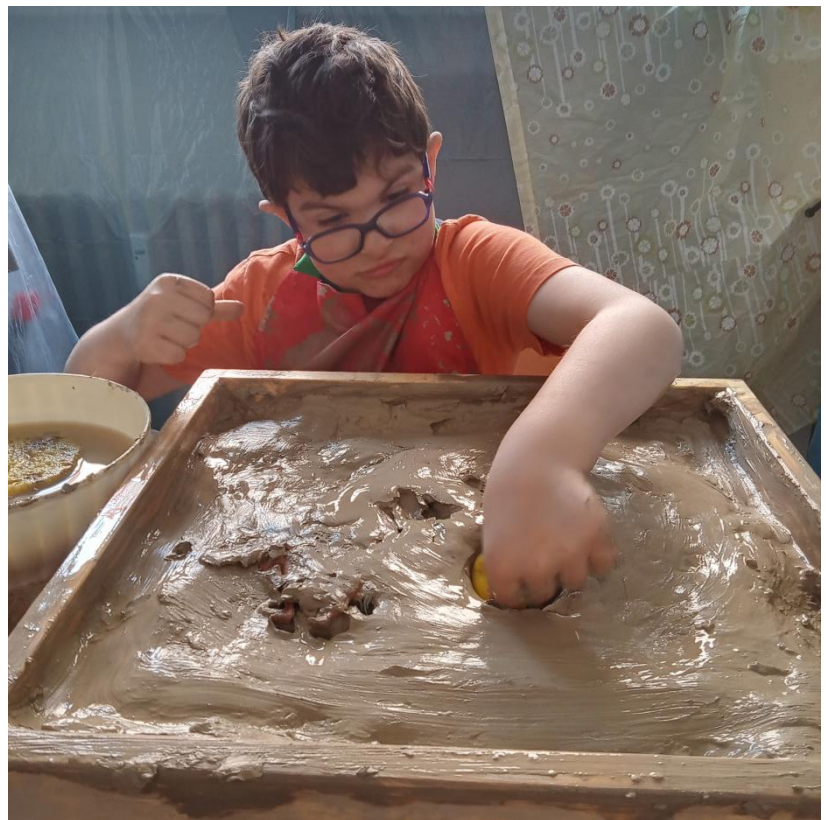
Rád'a a jeho soustředění