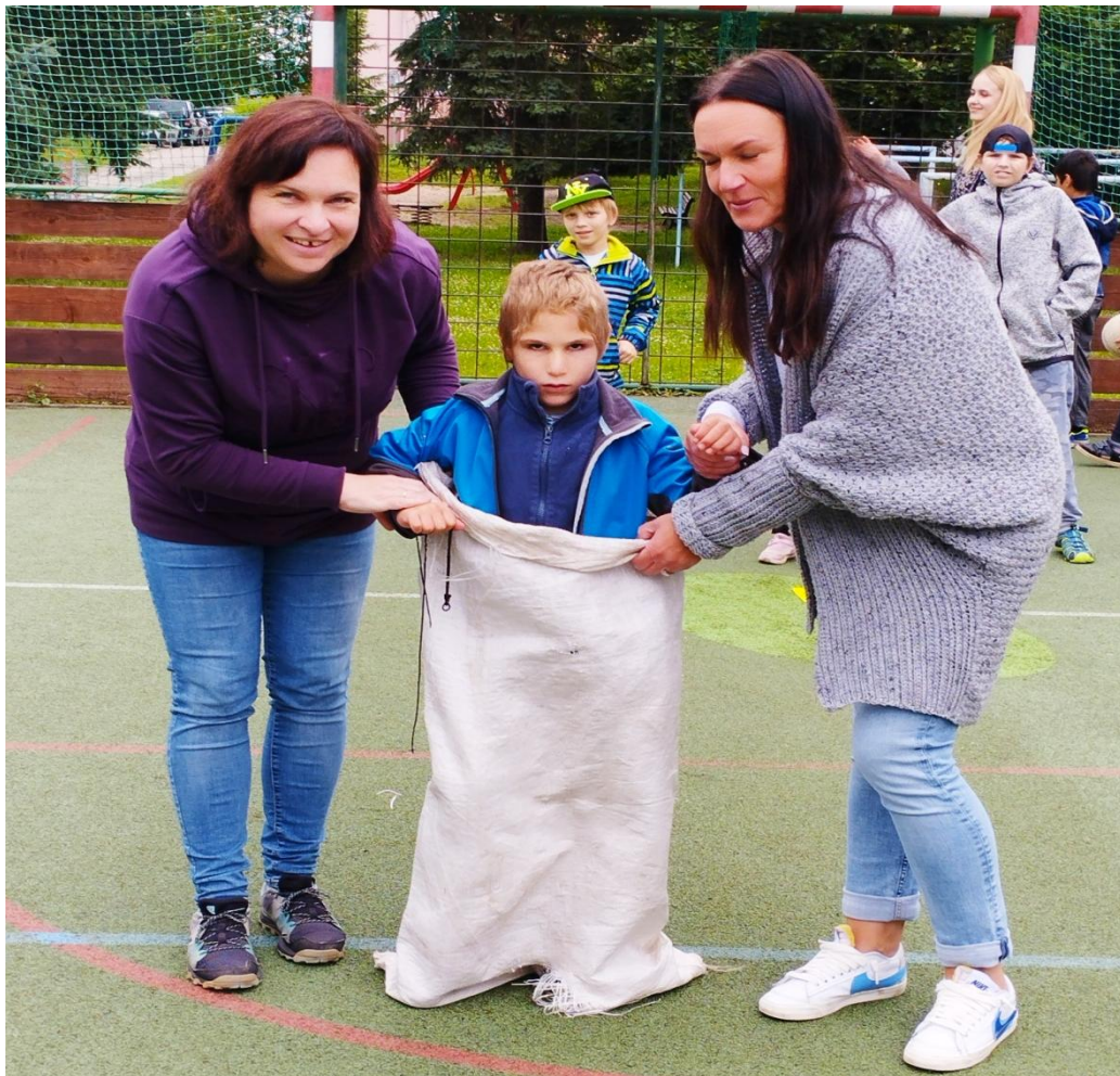
S dopomocí zvládneme vše