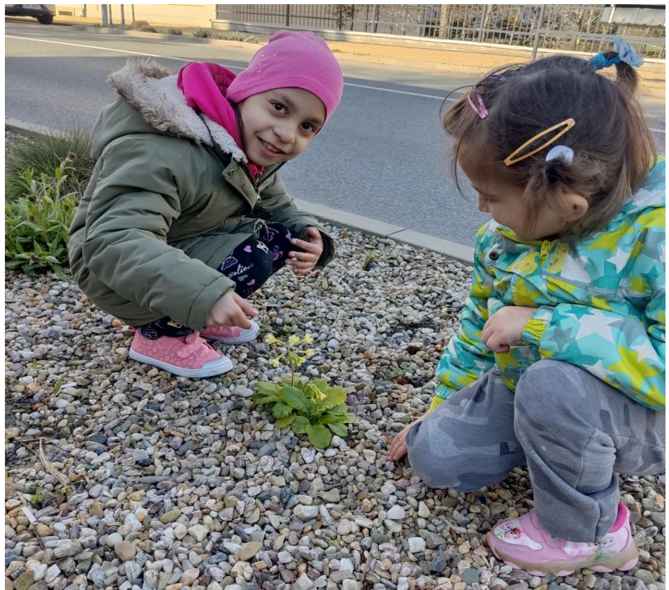
Objevily jsme petrklíč