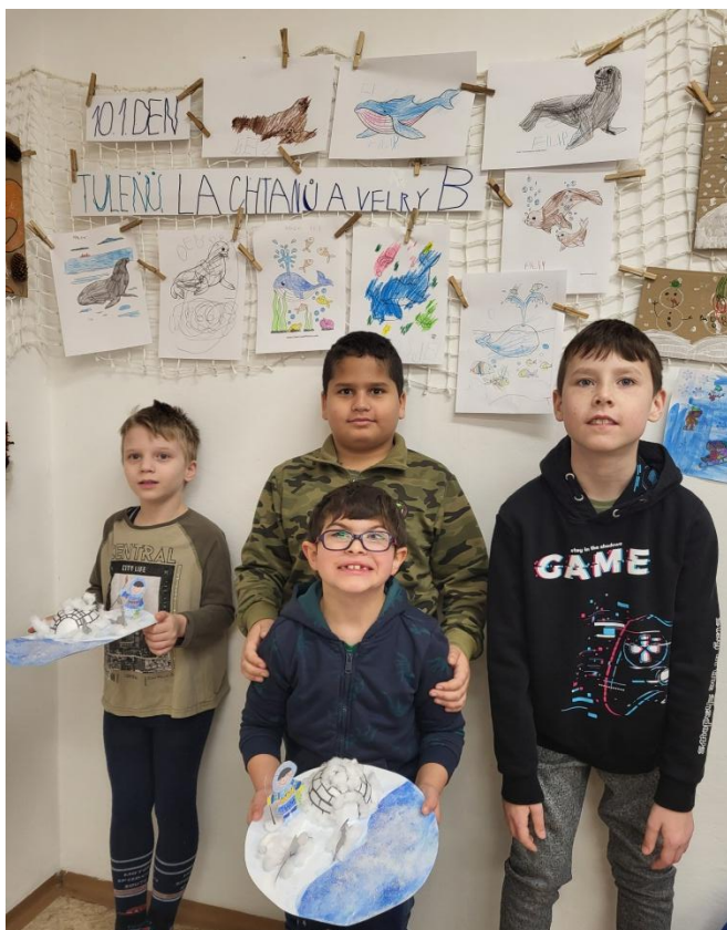
EVVO – projektový den

Angličtinu máme rádi. Učíme se sice základy jazyka, zato hravou formou. Učíme se lehce a zvesela.