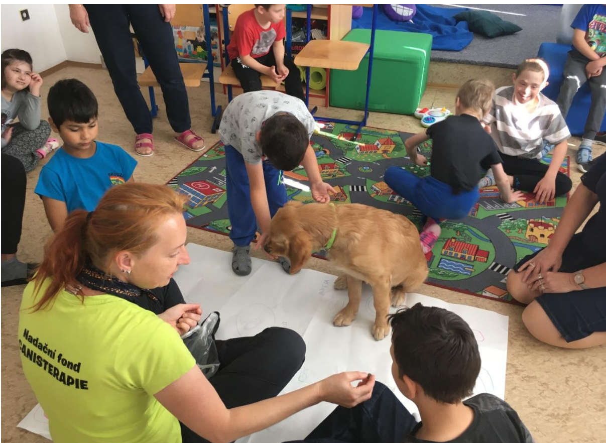
Canisterapie – naši noví psí kamarádi Uriáš a Ajša