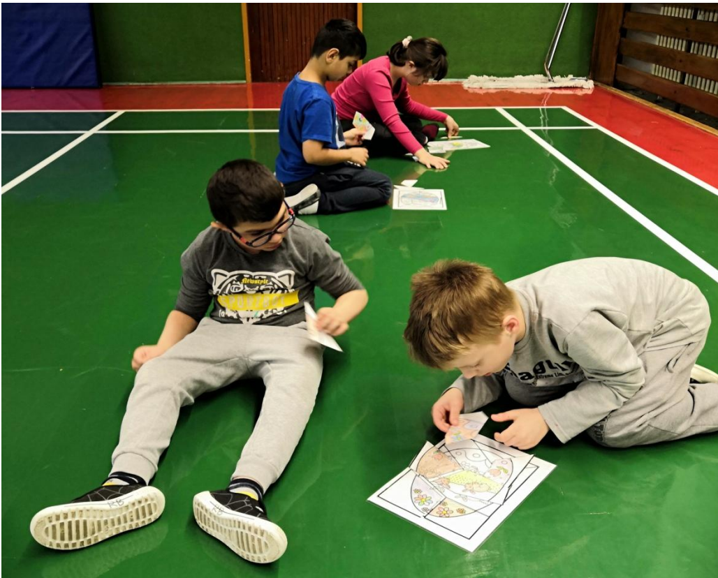
Skládám puzzle: vajíčko