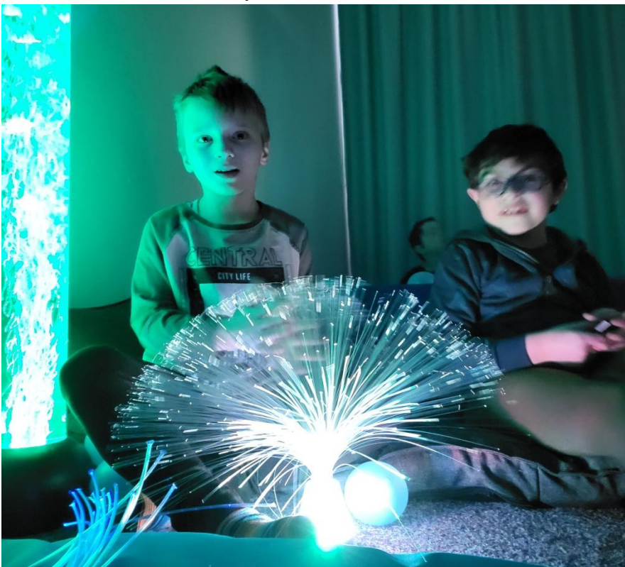
Světýlka máme rádi