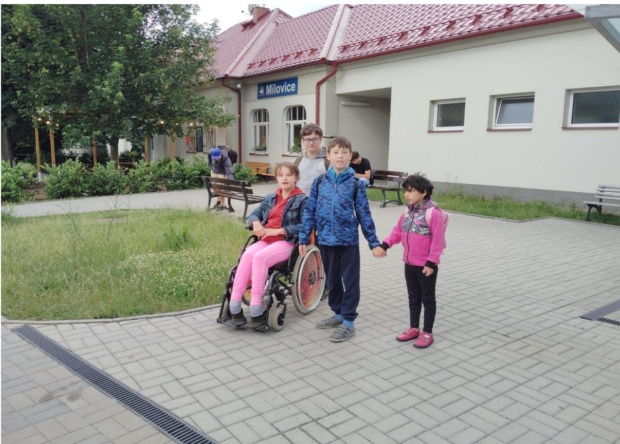
Na vlakovém nádraží v Milovicích