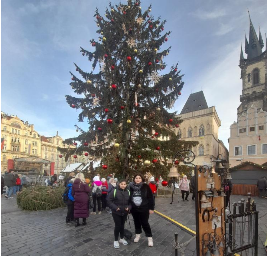
Praha, Staroměstské náměstí. U vánočního stromu.