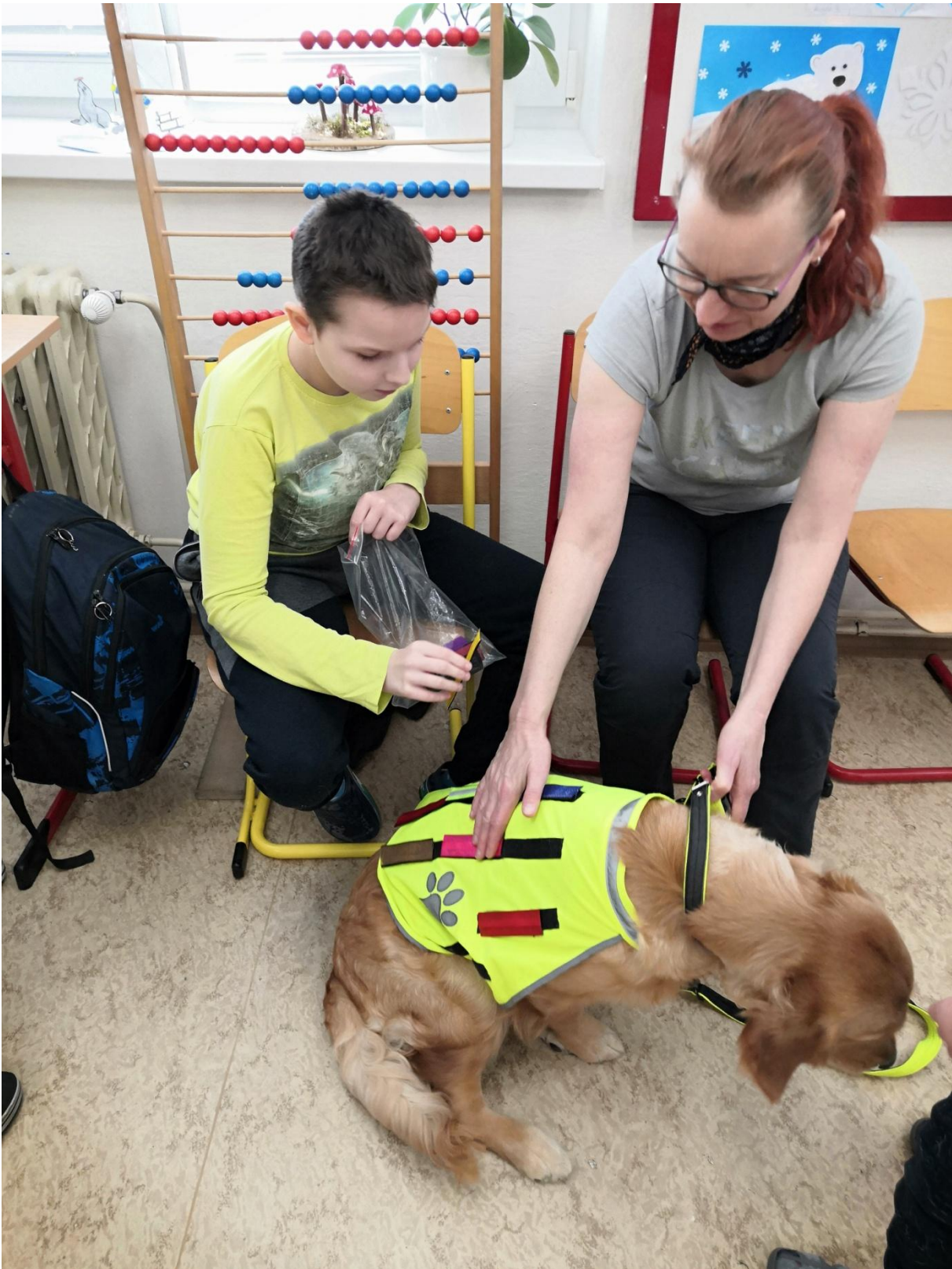
Canisterapie – procvičujeme barvy