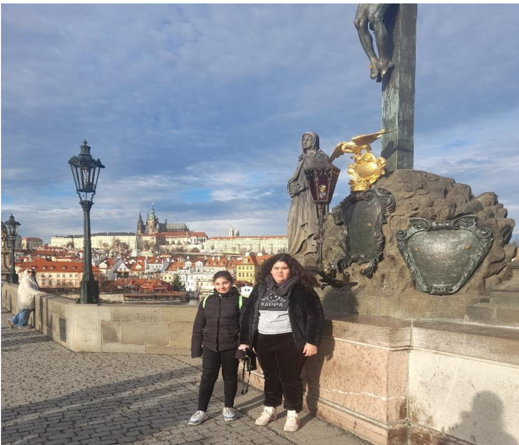
Karlův most, sousoší sv. Kříže