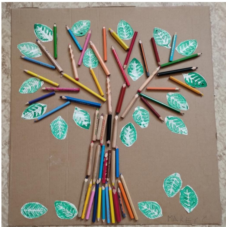
Strom z poškozených pasteliek