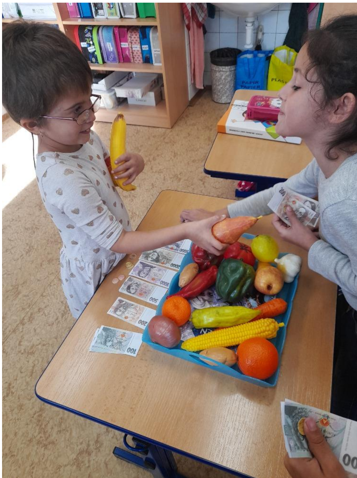
Celoroční projekt: Abeceda peněz Prodáváme, kupujeme