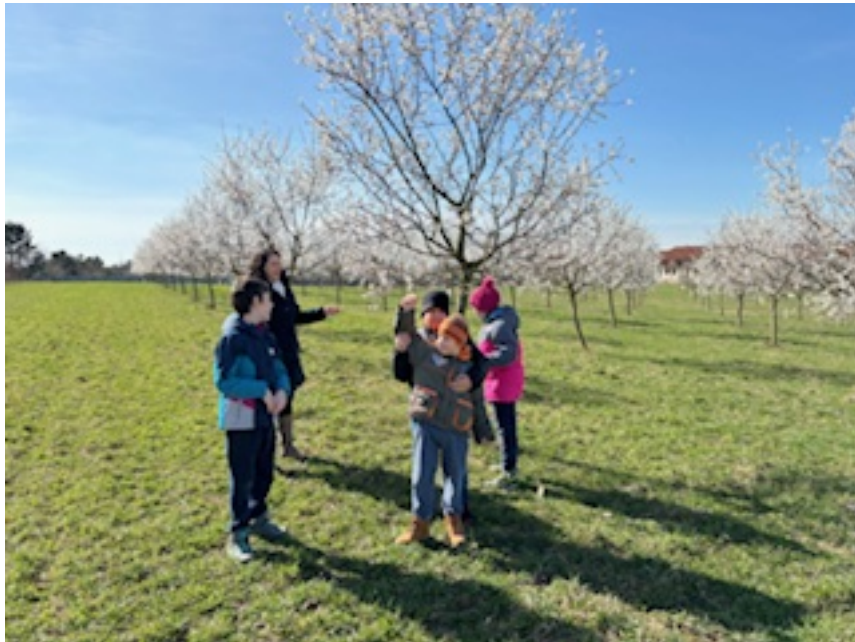
Mandloně krásně kvetou