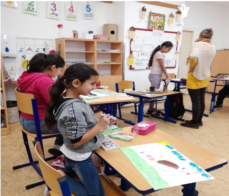
Arteterapie na téma: Jak se vidím jako zvíře