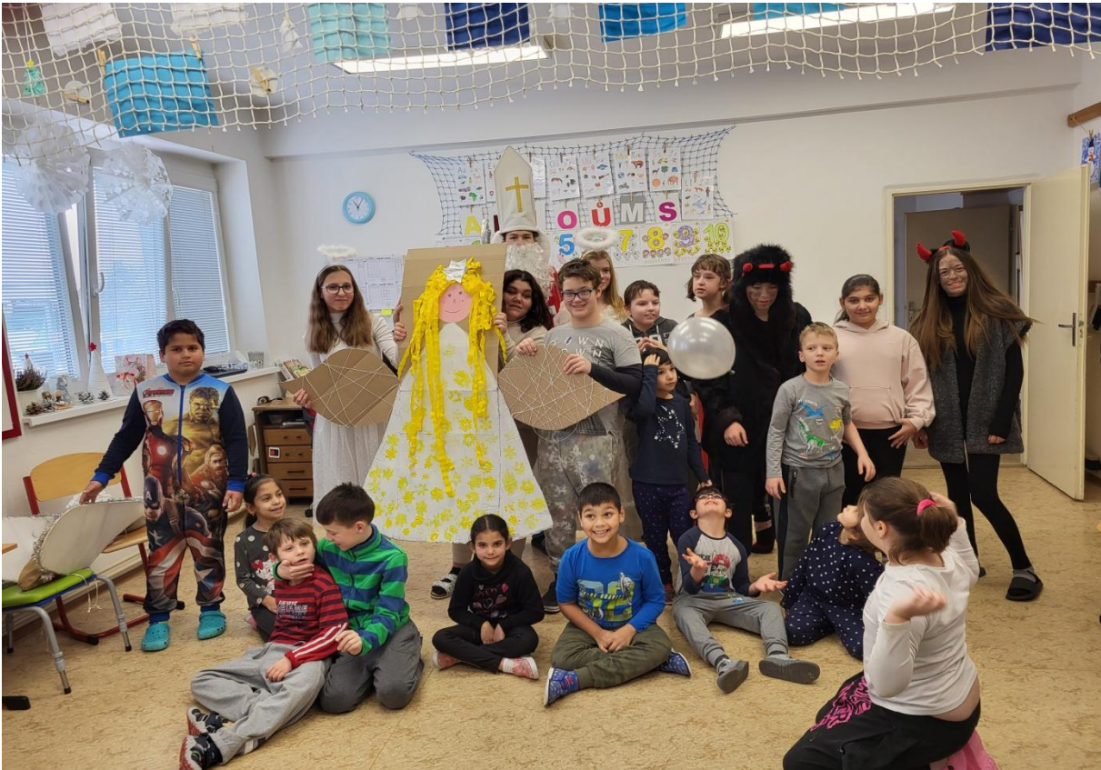
Přišel k nám Mikuláš, andělky a čerti. Nikoho si čerti neodnesli, všechny děti nám nechali.