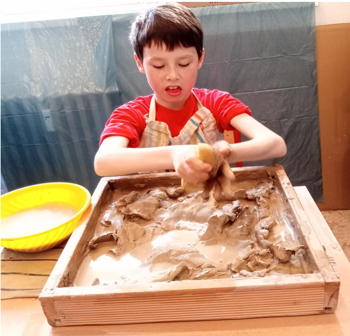
Patlání v hlíně je super (terapie Práce v hliněném poli)