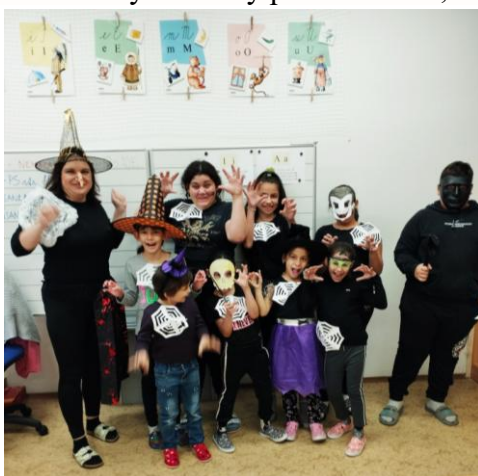
Halloweenský den se povedl

Pilně nacvičujeme básničky a koledy pro Mikuláše, těšíme se na Ježíška.