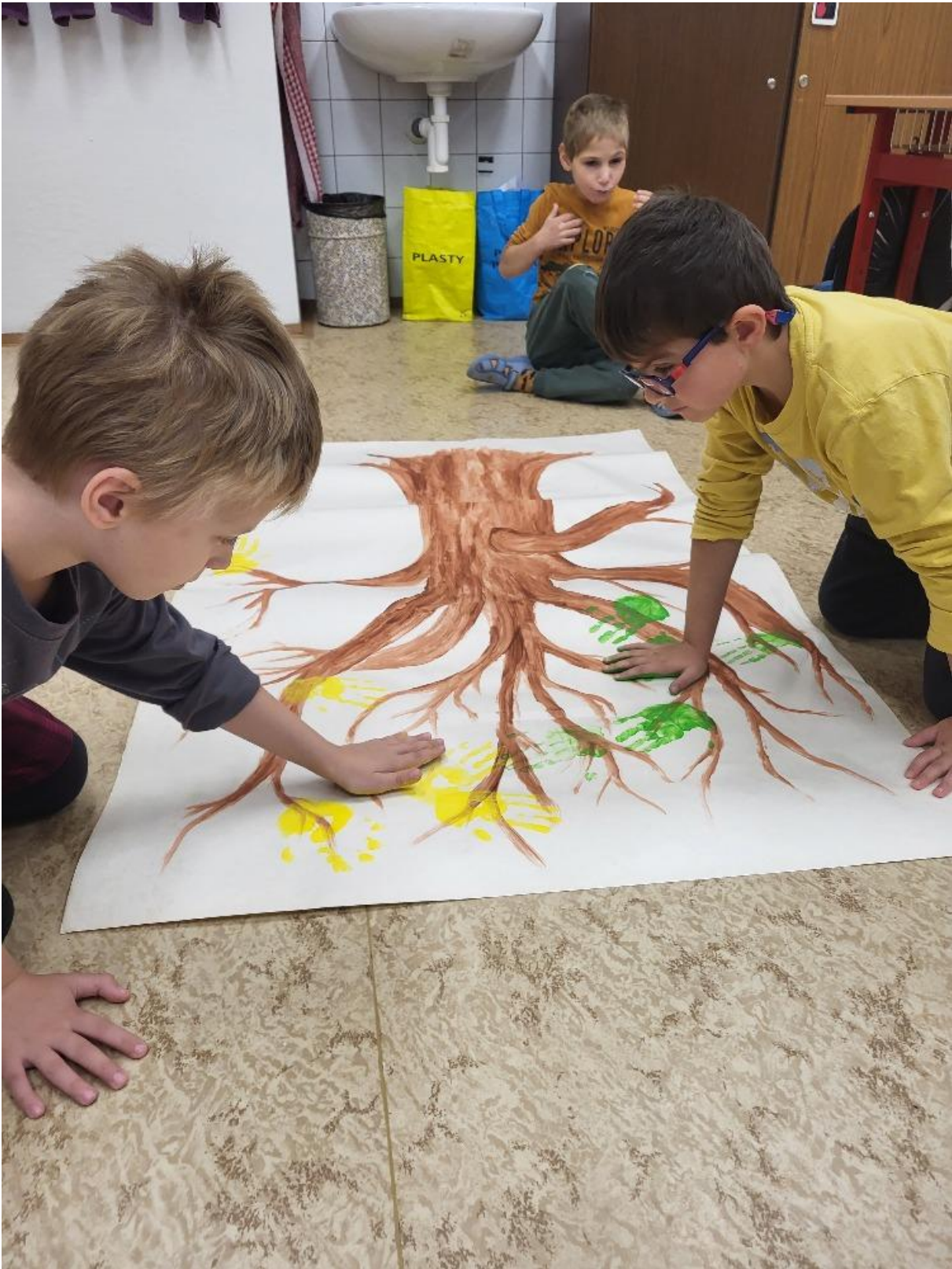
EVVO Den stromů – projektový den